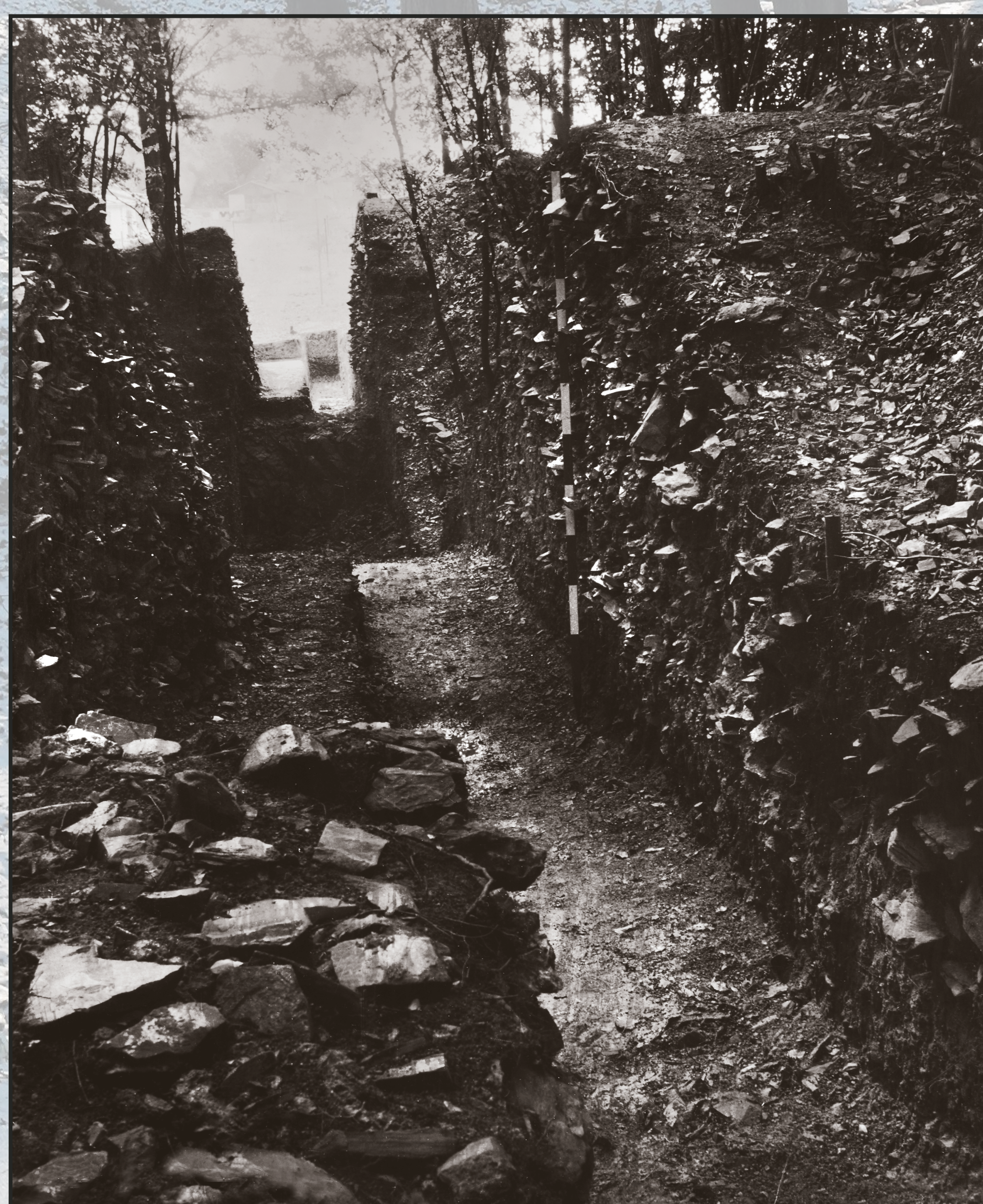
Sonda napříč fortifikačním systémem na Sekance