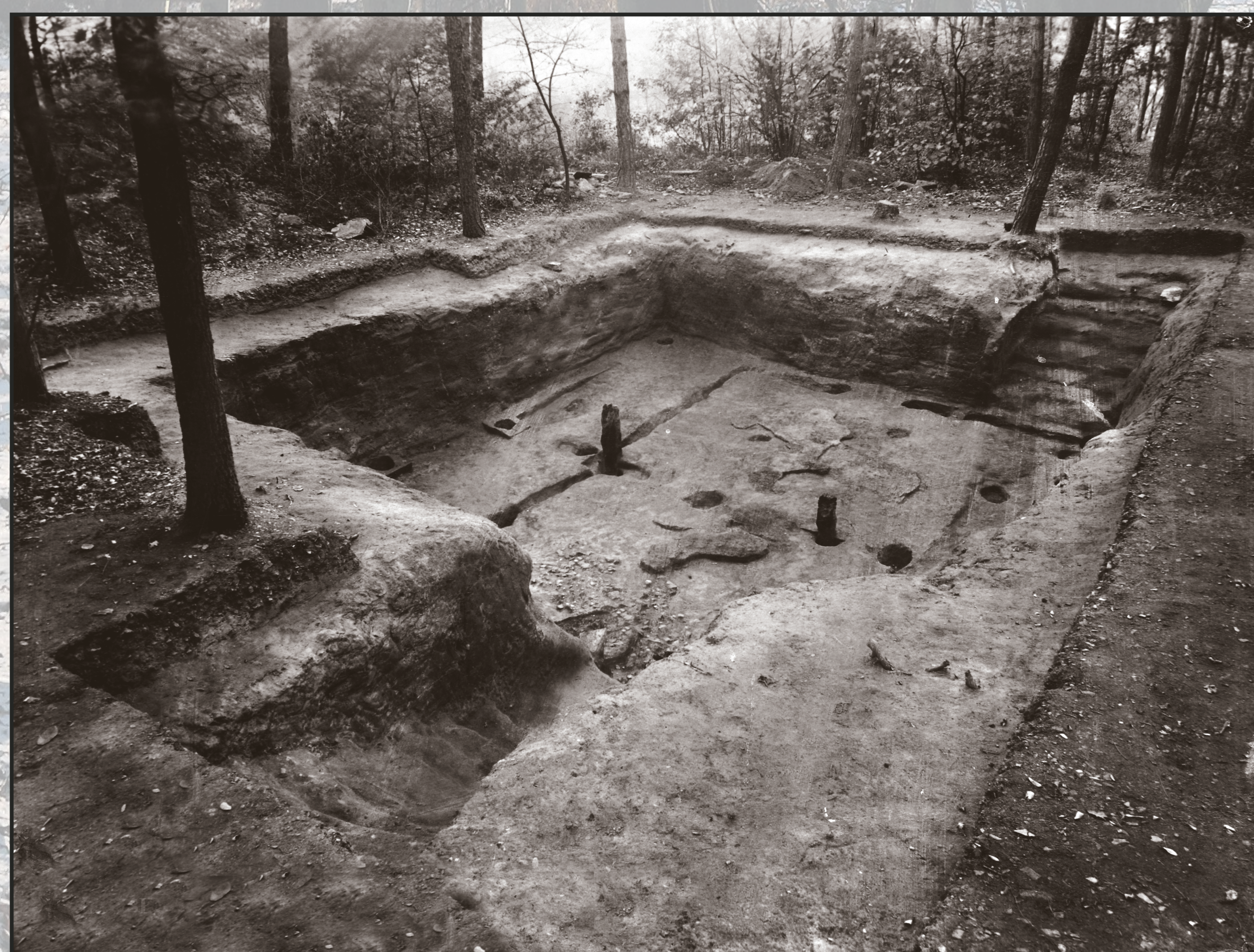
Pohled na odkryté základy jednoho z domů