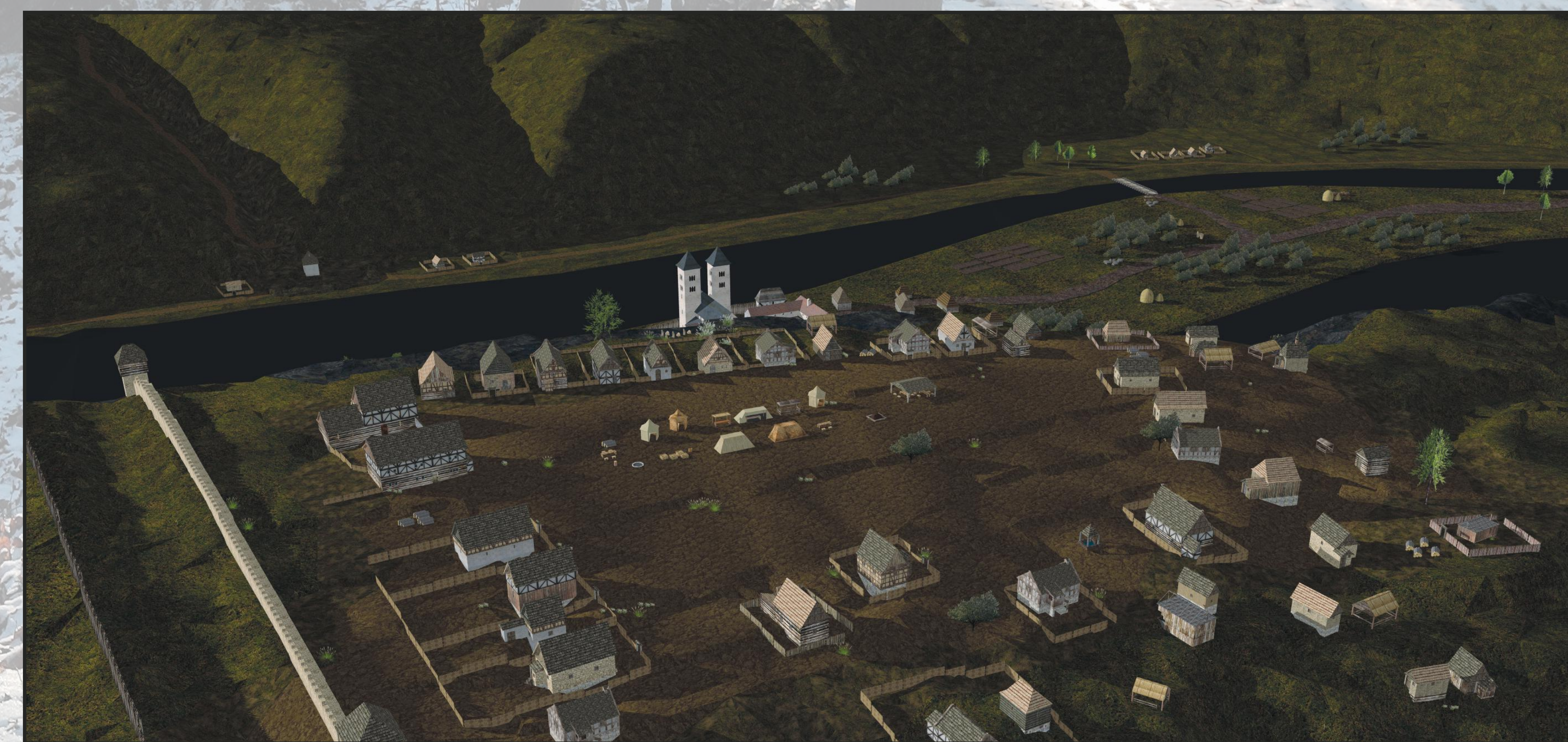
Celkový pohled na sídliště na Sekance a Ostrovský klášter