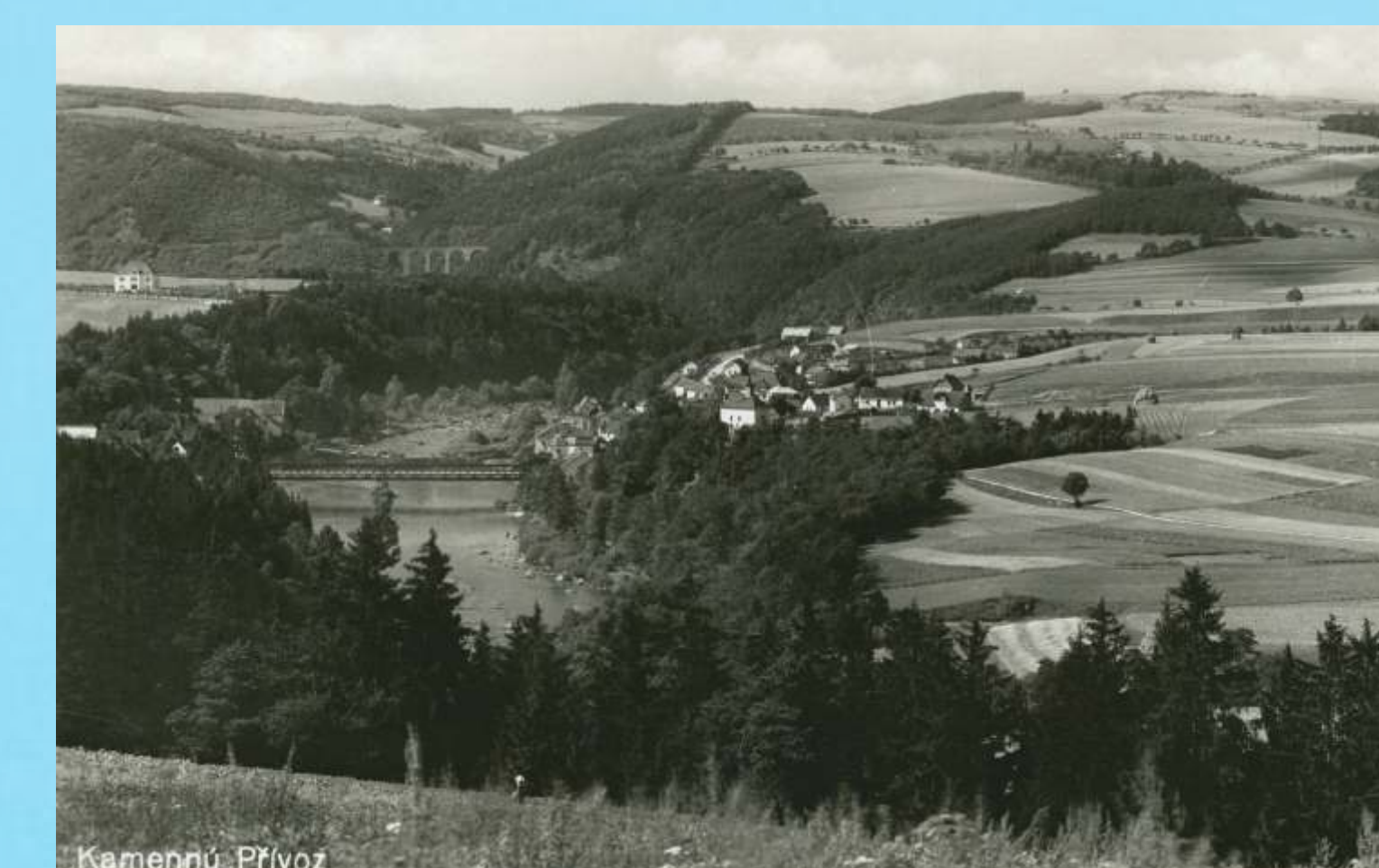
Kamenný Přívoz, rok 1939