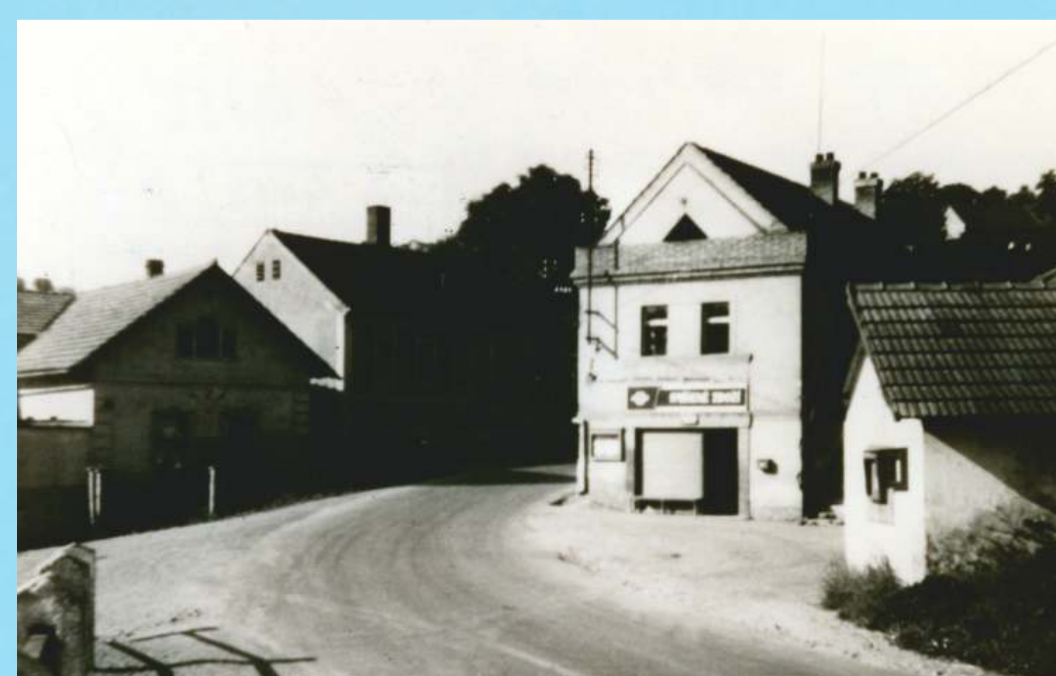
Kamenný Přívoz, rok 1950