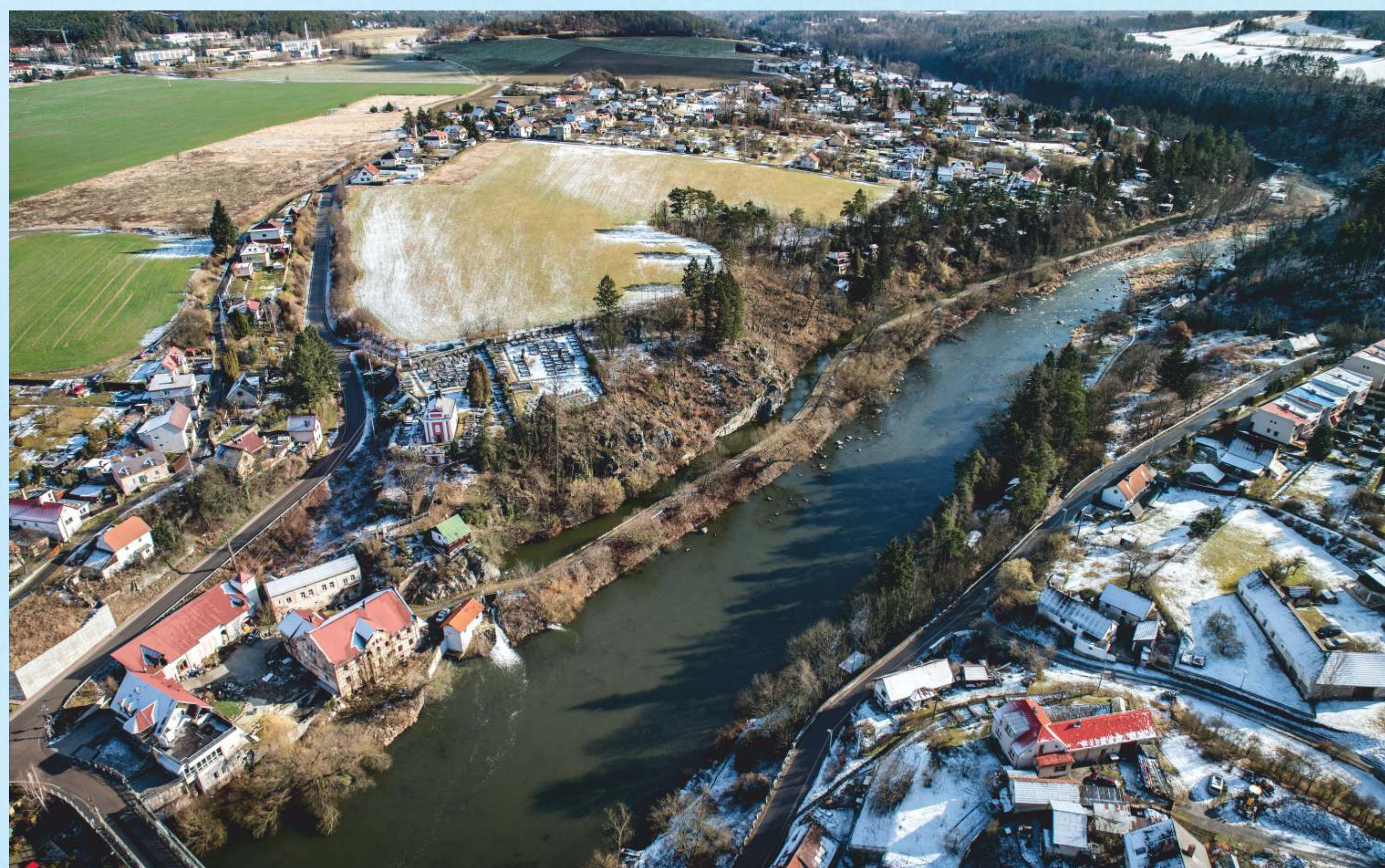
Kamenný Přívoz a řeka Sázava