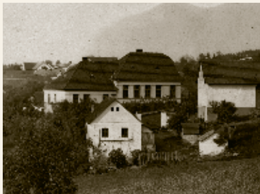
Škola Krňany, třicátá léta