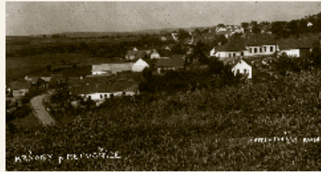
Krňany, třicátá léta