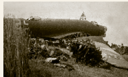
Krňany, nouzové přístání, 1941