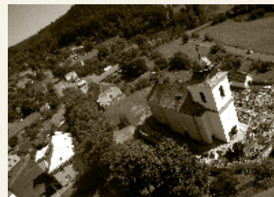
Vysoký Újezd, 2011

Informace: Sdružení Mezi řekami tel.: +420 603 196 678 , www.mezirekami.cz