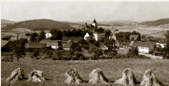
Vysoký Újezd, 1941