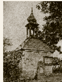
Krňany, čtyřicátá léta