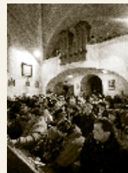
Vysoký Újezd, 2011