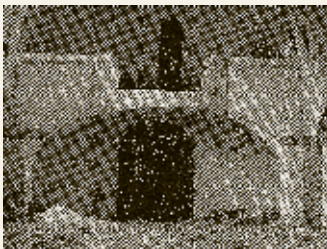
Vysoký Újezd, 1945