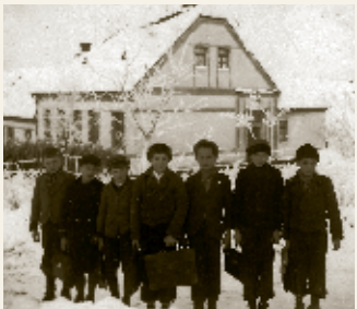
Školáci, třicátá léta