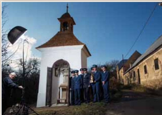
SDH Teletín 2012