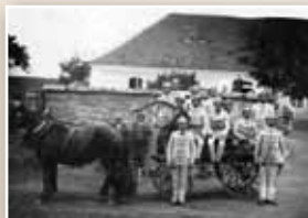
Sbor dobrovolných hasičů Teletín 1903