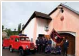
Sbor dobrovolných hasičů Teletín 2013