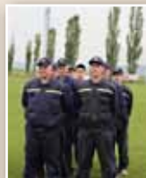
SDH Teletín, Okrskové cvičení 2011