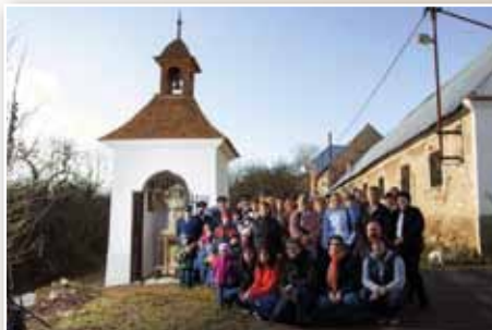
SDH Teletín a občané Teletína 2012