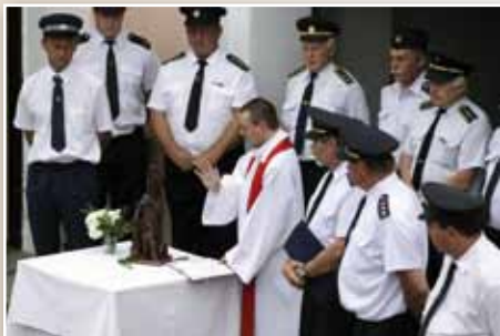
Svěcení sv. Floriána 2011