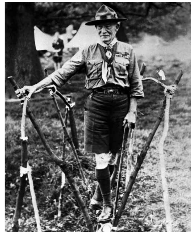
Anglický lord Baden Powel, propagátor anglického skautingu a Junáka. Kolem roku 1920.

Myšlenkově čerpali z odkazu amerického přírodovědce, spisovatele a malíře Ernesta Thompsona Setona, který založil první organizaci tzv. woodcraftu, lesní moudrosti. Vzorem mu byl život přírodních Indiánů.