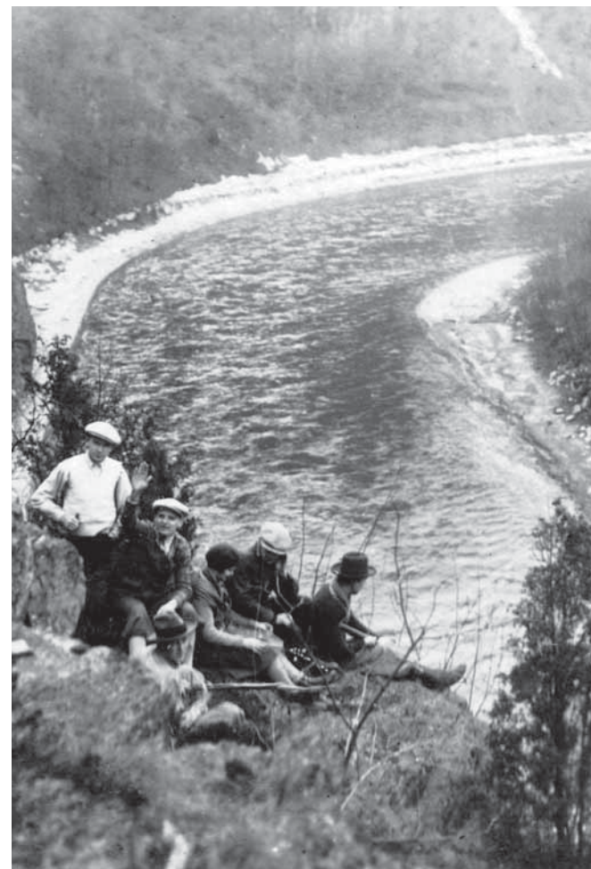
Osada Red River na výletě. Pohled na Vltavu.

Vpravo od tohoto tábora je rokle (ve které bývala osada „Utah“), směřující k nynější Štěchovické přehradě, která byla dostavena koncem války. Tato rokle se proslavila známým Štěchovickým pokladem. Byl to archiv německého ministra, který Němci v těchto místech zakopali koncem války a který Američani podle informací některých německých důstojníků tajně odnesli. Práce na tajné skrýši vykonávali trestanci z koncentráku na Hradištku, převážně Italové a Francouzi, a které Němci potom zastřelili na silnici mezi myslivnou a Závistí. Stojí tam velký dřevěný kříž.